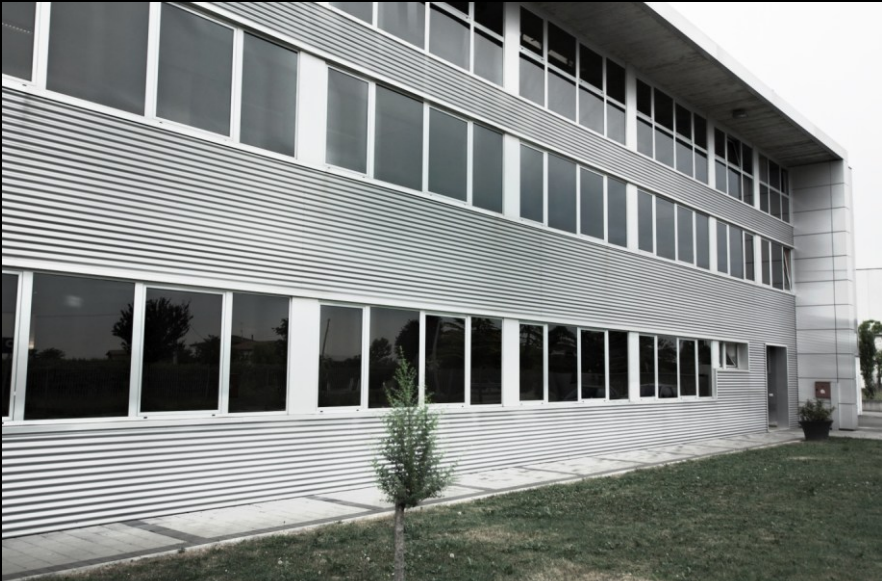
City Design S.p.A.